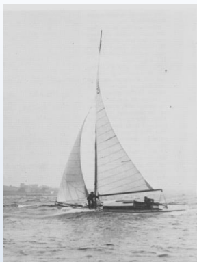
"Gækken" under sejladsen i 1938

Kerteminde Sejlklub indbyder hermed danske og udenlandske tursejlere til at deltage i Danmarks ældste distancesejlads "Classic Fyn Rundt".